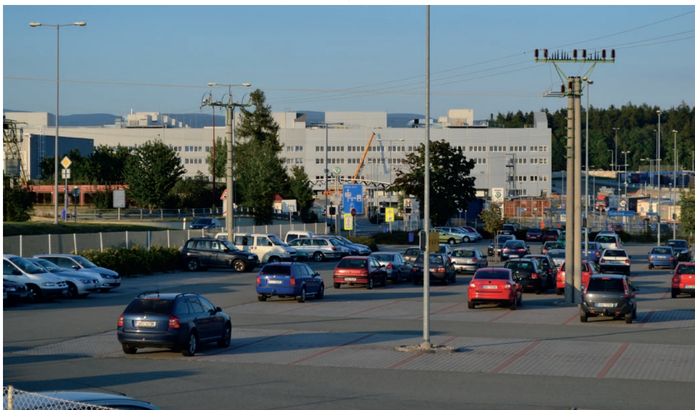
Jednou z významných oblastí obchodu je automobilový průmysl. Snímek závodu Škoda Auto Kvasiny.

Hovoříme zde o tzv. komoditní struktuře vzájemného obchodu s Polskem. Je zřejmé, že za sledované období je tato komoditní struktura víceméně stabilní.