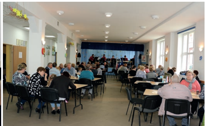
Mikroprojekt CZ.11.4.120/0.0/0.0/16_008/0000367 s názvem „Přátelství bez hranic“, gmina Kondratowice - „prezentace české kuchyně v Kondratowicích“

Vydává Euroregion Pomezí Čech, Moravy a Kladska – Euroregion Glacensis, Panská 1492, 516 01 Rychnov nad Kněžnou, Česká republika ve spolupráci se Stowarzyszeniem Gmin Polskich Euroregionu Glacensis, Łukasiewiczza 4a/2, 57-300 Kłodzko, Polsko